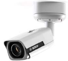
ボッシュ製監視カメラ (型番:NBE-5503-AL)

2018年5月より、同社製品を新たにサポートした「ArgosView」新バージョンを順次提供してまいります。